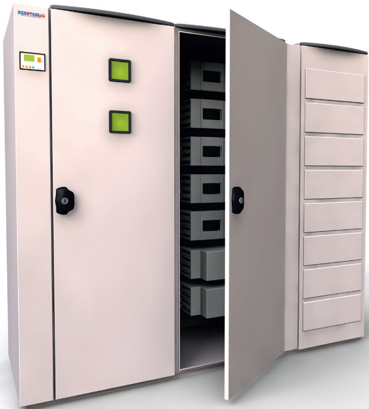
Tableau Électrique Basse Tension Aide à la spécification